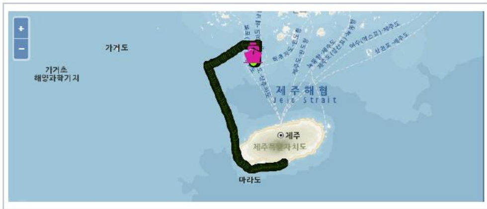
<2026. 3. 16. (월) 해양환경방사선량률 변동추이>